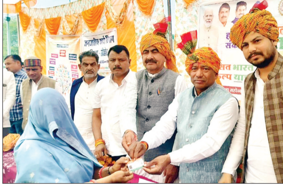
आष्टा। भारत विकसित यात्रा के तहत ग्रामीणों को योजनाओं का दिशा लाभ।